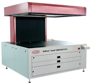
Imagen en alta resolución

Última Generación Equipo de Insolación con un control mejorado de potencia UV