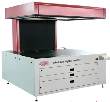
Imagen en alta resolución

DuPont Packaging Graphics sigue consolidando su posición de líder mundial, como proveedor de sistemas de impresión flexográfica. Nuestros nuevos desarrollos se aplican constantemente en nuevas tecnologías para soluciones exclusivas, que facilitan a nuestros clientes la expansión de su negocio, al permitirles sacar partido de oportunidades nuevas y rentables en el mercado de impresión del embalaje. Nuestro catálogo de productos incluye la marca Cyrel® de planchas de fotopolímero ( analógicas y digitales), equipos de confección de planchas Cyrel®, camisas Cyrel® , sistemas de montaje de planchas Cyrel® y el revolucionario sistema térmico Cyrel® FAST .