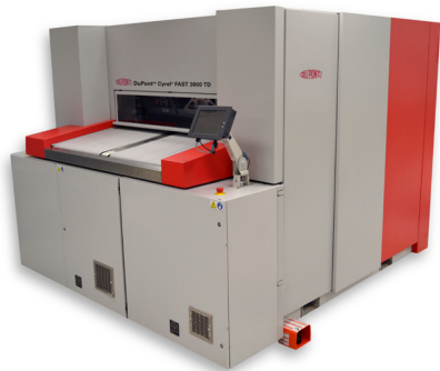
Imagen en alta resolución