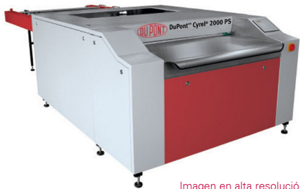
Imagen en alta resolución