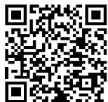
Descarga de la última versión

DuPont Packaging Graphics sigue consolidando su posición de líder mundial, como proveedor de sistemas de impresión flexográfica. Nuestros nuevos desarrollos se aplican constantemente en nuevas tecnologías para soluciones exclusivas, que facilitan a nuestros clientes la expansión de su negocio, al permitirles sacar partido de oportunidades nuevas y rentables en el mercado de impresión del embalaje. Nuestro catálogo de productos incluye la marca Cyrel® de planchas de fotopolímero ( analógicas y digitales), equipos de confección de planchas Cyrel®, camisas Cyrel® , sistemas de montaje de planchas Cyrel® y el revolucionario sistema térmico Cyrel® FAST .