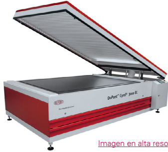
Imagen en alta resolución