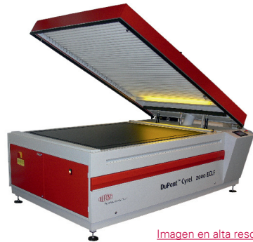
Imagen en alta resolución