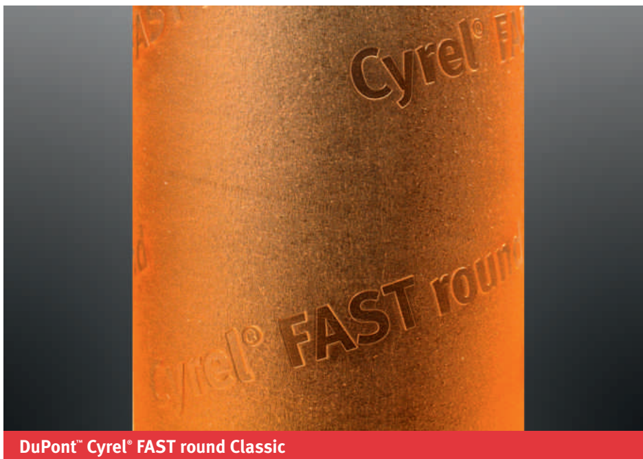
DuPont™ Cyrel® FAST round Classic