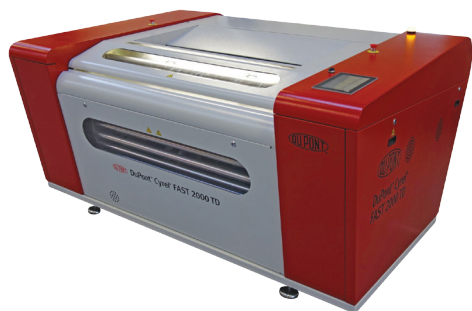
Imagen en alta resolución