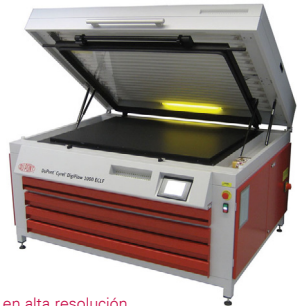
Imagen en alta resolución

Última generación de Insoladora y Luz de Acabado y Pos Insolación