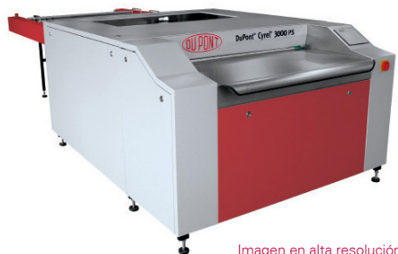
Imagen en alta resolución