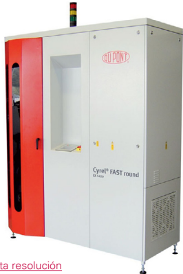
Imagen en alta resolución