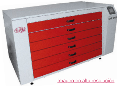
Imagen en alta resolución