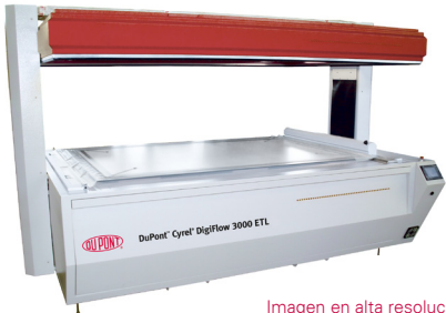
Imagen en alta resolución