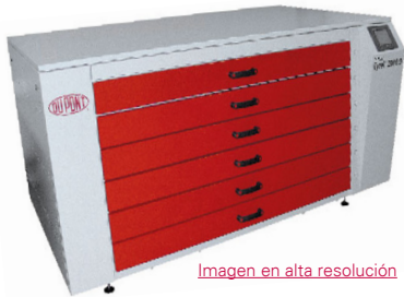
Imagen en alta resolución