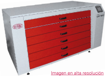
Imagen en alta resolución