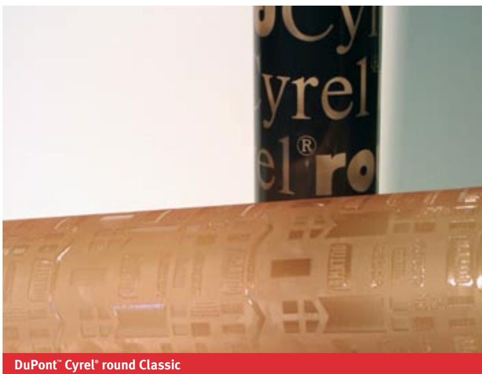
DuPont™ Cyrel® round Classic